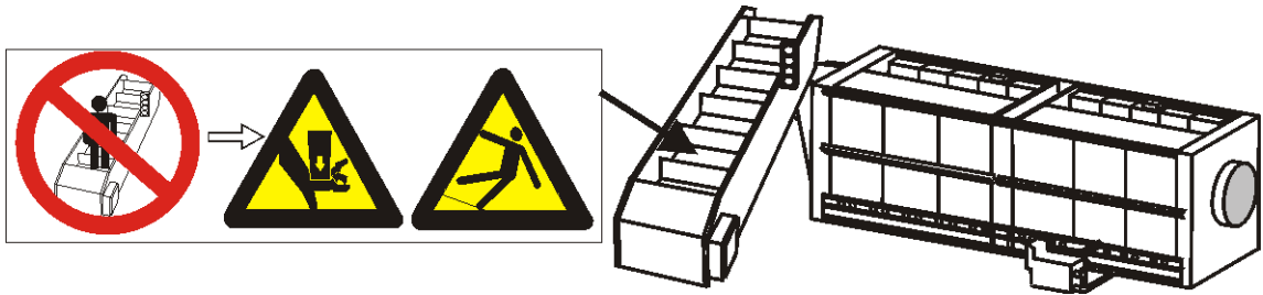
图 1: 机器外部的风险

贴在机器上的一张或者多张安全警示，类似于下面图示：提示员工注意机器前罩板、侧板、后板及顶部的危险。