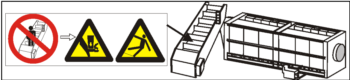
Imagem 1: Riscos Mecânicos Externos

Uma ou mais placas de segurança na máquina, similares às apresentadas a seguir, alertam as pessoas sobre riscos existentes ao redor da parte frontal, laterais, traseira ou parte superior da máquina.